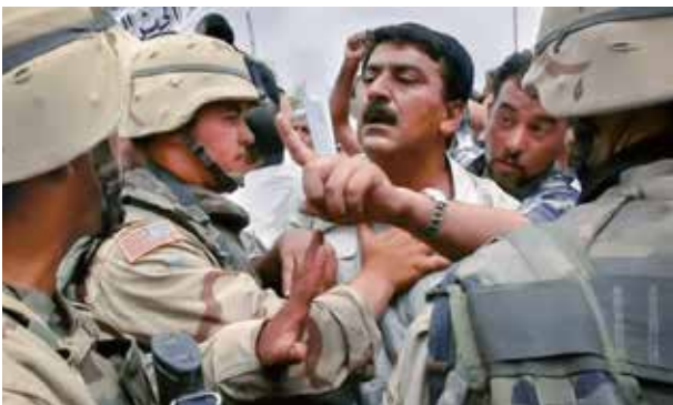
2003年,被解散的伊拉克军队士兵向美军抗议。