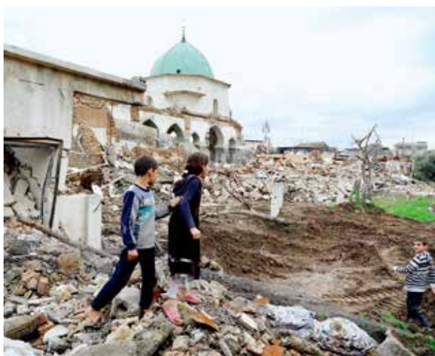
2018年，伊拉克摩苏尔，被极端组织“伊斯兰国”炸毁的努里清真寺废墟。

其次，伊拉克沦为恐怖主义的渊藪。扎卡维等极端分子利用战争乱局，在伊拉克成立“基地”组织分支并强势