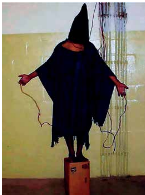
2003年，阿布格莱布监狱的虐囚场景。

在臭名昭著的阿布格莱布监狱，美军使用水刑、睡眠剥夺、人身羞辱等手段刑讯逼供。甚至有被关押人员被当