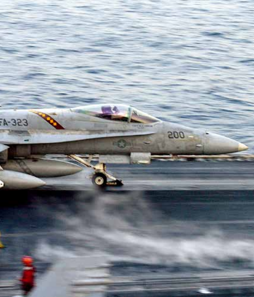
2003年3月20日，一架美国海军战斗机从航空母舰甲板上起飞，作战目标是伊拉克巴格达等城市。

理会授权发动海湾战争不同，美国发动伊拉克战争时，遭到国际社会大多数国家强烈反对，其中包括许多欧洲和阿拉伯盟友。